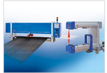
Mess- und Prüfanlagen zur Qualitätssicherung