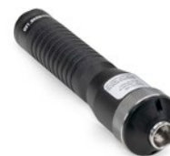
SuperNova LED Hand-Lichtquelle