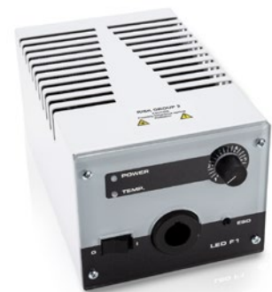
FOT LED ohne Lüfter

*abhängig von Umgebungstemperatur und Raumfeuchte und der betriebenen Intensität