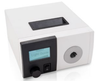
FOT LED 3000 / 5100