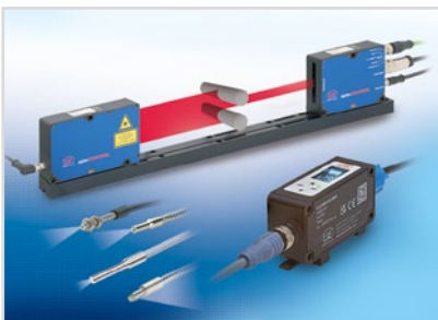
Optische Mikrometer, Lichtleiter, Mess- und Prüfverstärker